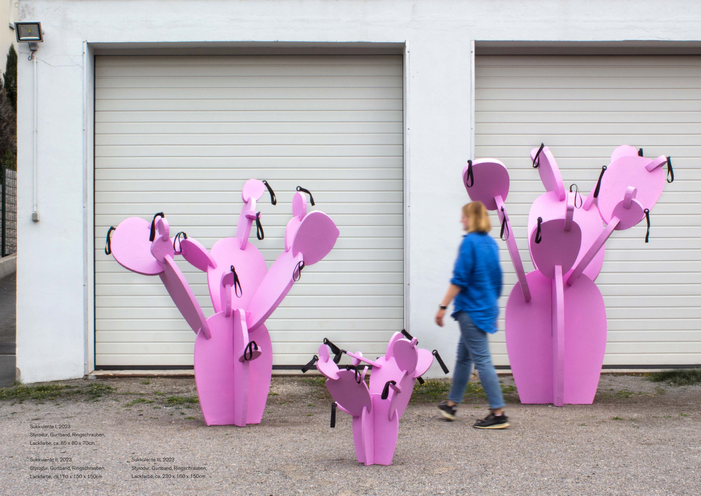
Sukkulent I, 2023 Styrodur, Gurtband, Ringschrauben, Lackfarbe, ca. 85 x 80 x 70cm