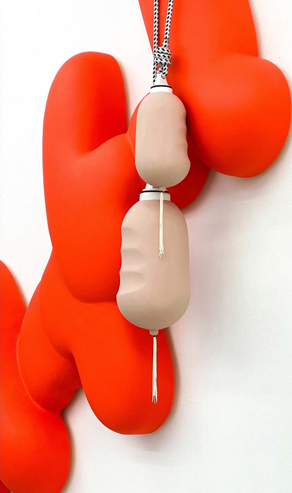
Inflatable // Maybe Wall, 2025 3D-Druck, Lackfarbe, Gurtband, Fransenborte, O-Ring, ca. 125 x 240 x 30 cm