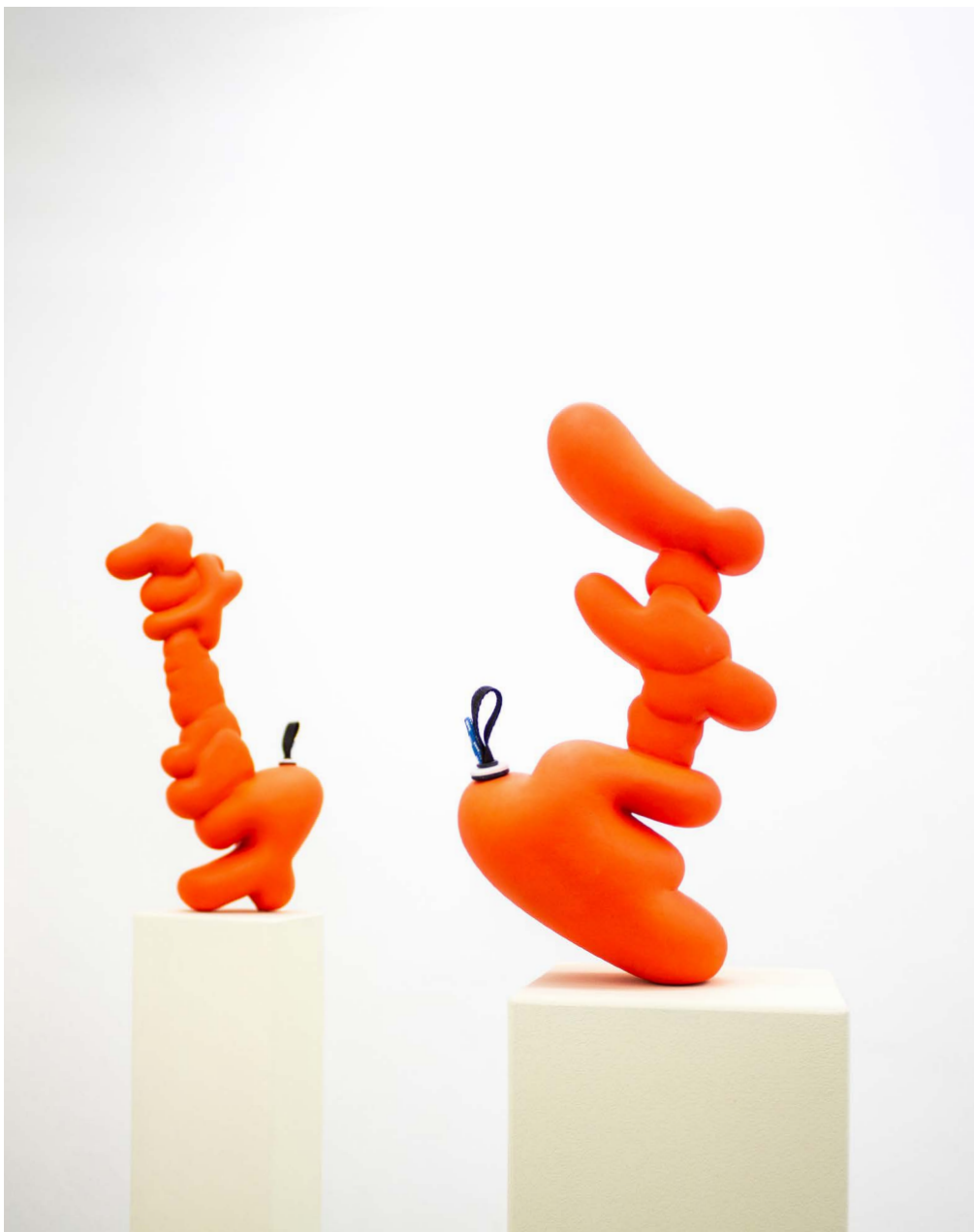
Inflatable // Apparently, 2025 3D-Druck, Lackfarbe, Gurtband, O-Ring, Fransenborte, MDF ca. 185 x 19 x 19 cm